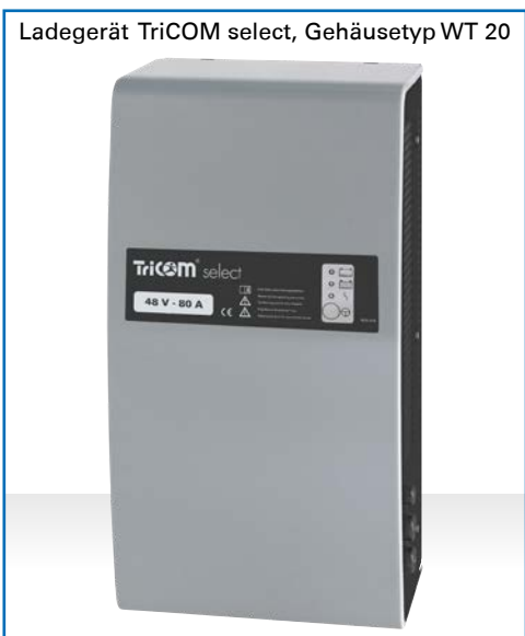
Ladegerät TriCOM select, Gehäusetyp WT 20