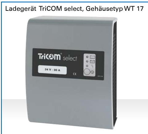
Ladegerät TriCOM select, Gehäusetyp WT 17