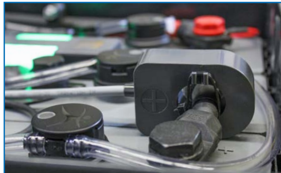
Optional: auch ohne Strommesskopf lieferbar.